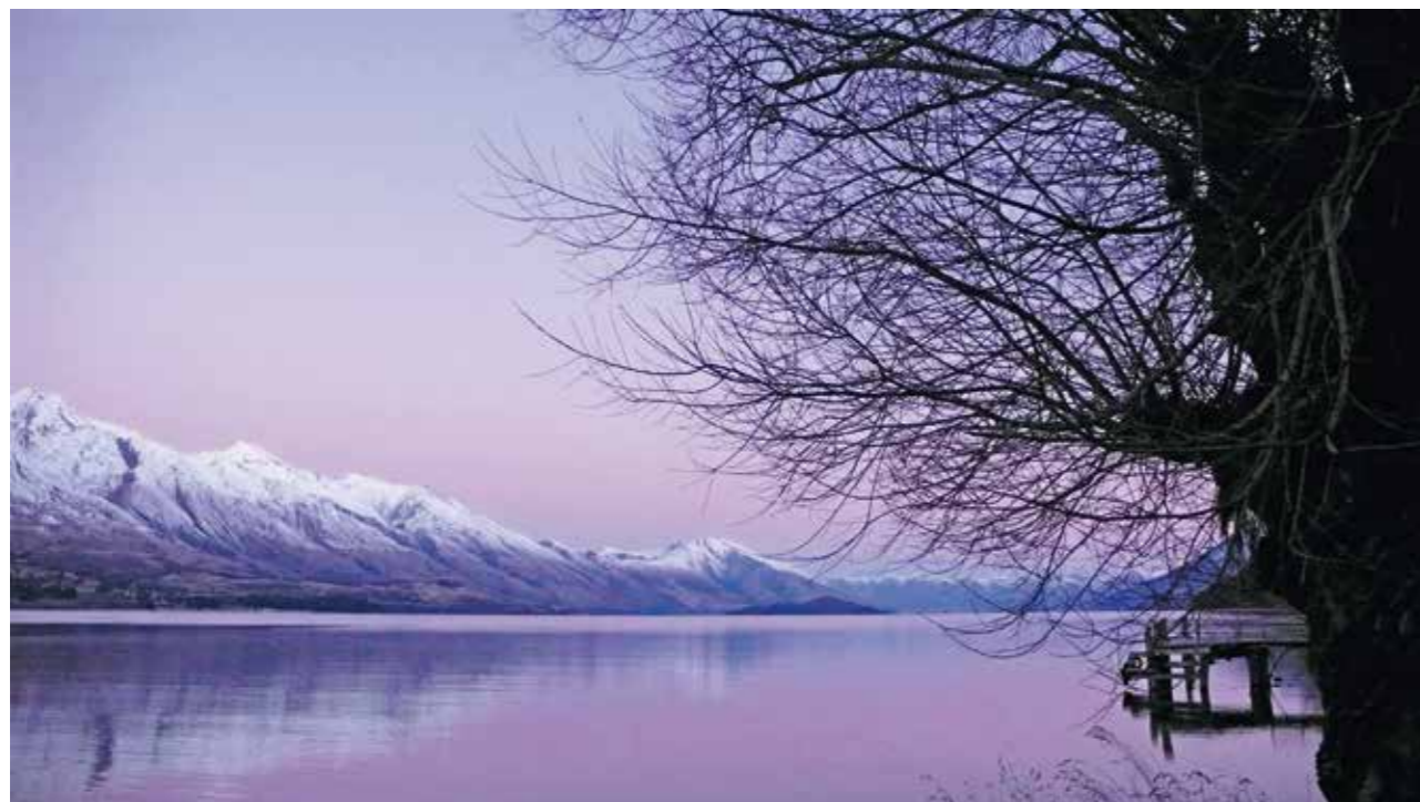
Sunset over Kinloch in winter, on the shores of Lake Wakatipu . Coucher de soleil sur Kinloch en hiver, au bord du lac Wakatipu .