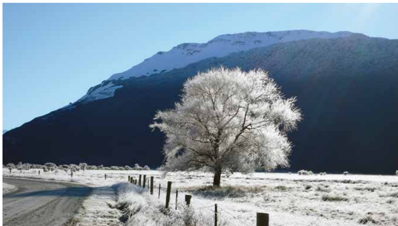
Hoar frost on Greenstone Road . Greenstone Road , sous le givre.

«Ma propre cabane à Glenorchy est très simple. Délibérément simple. Une chambre à coucher, un salon, une salle de bains, une terrasse. Je l'ai construite de toutes pièces, avec l'aide d'un ami. Je l'ai conçue en m'inspirant à la fois des refuges de randonneurs que l'on trouve en Nouvelle-Zélande, et de ce je pensais être les dimensions parfaites d'une pièce que l'on veut partager avec d'autres. J'en suis venue à détester les maisons, ces fades repré-