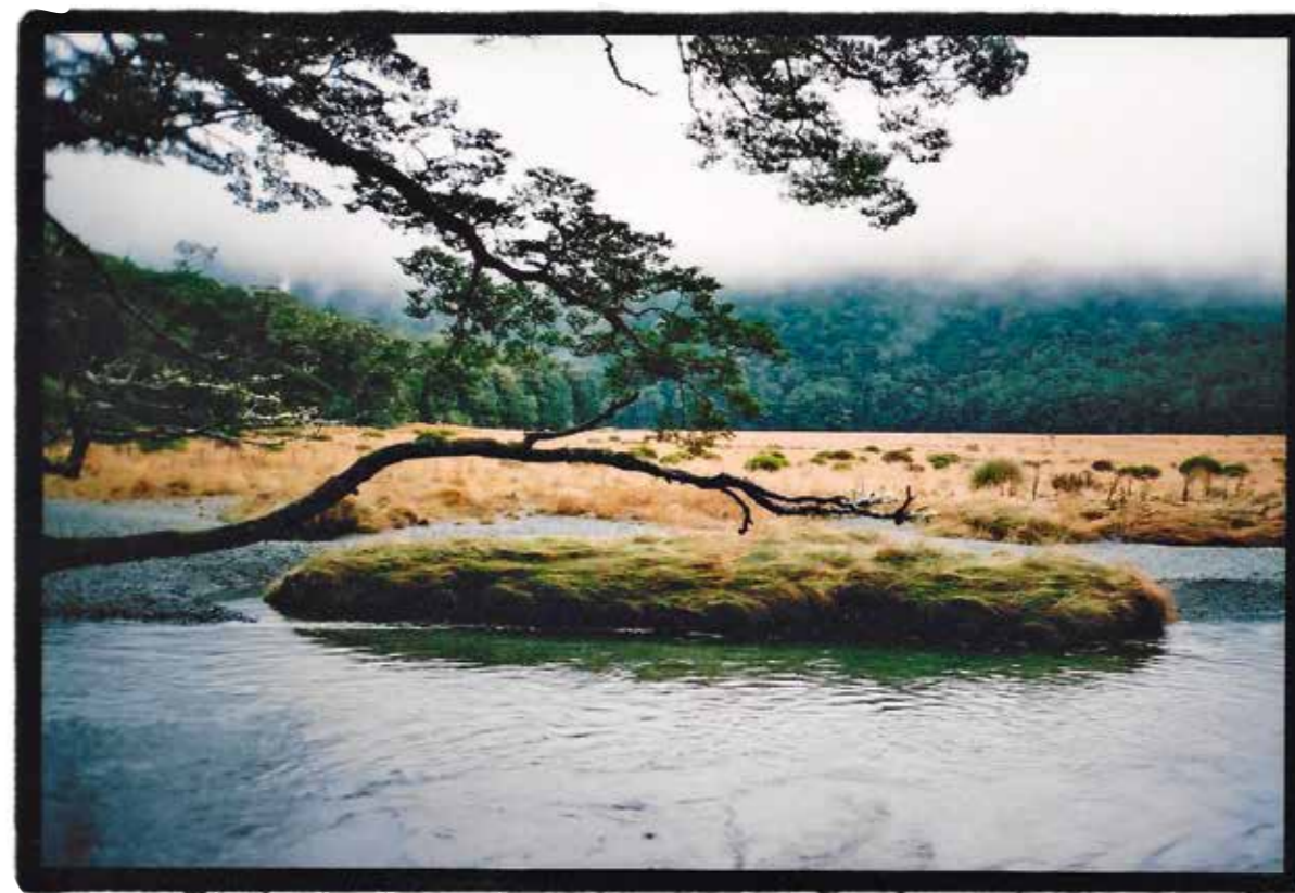
Along the Routeburn Track. Sur le Routeburn Track.