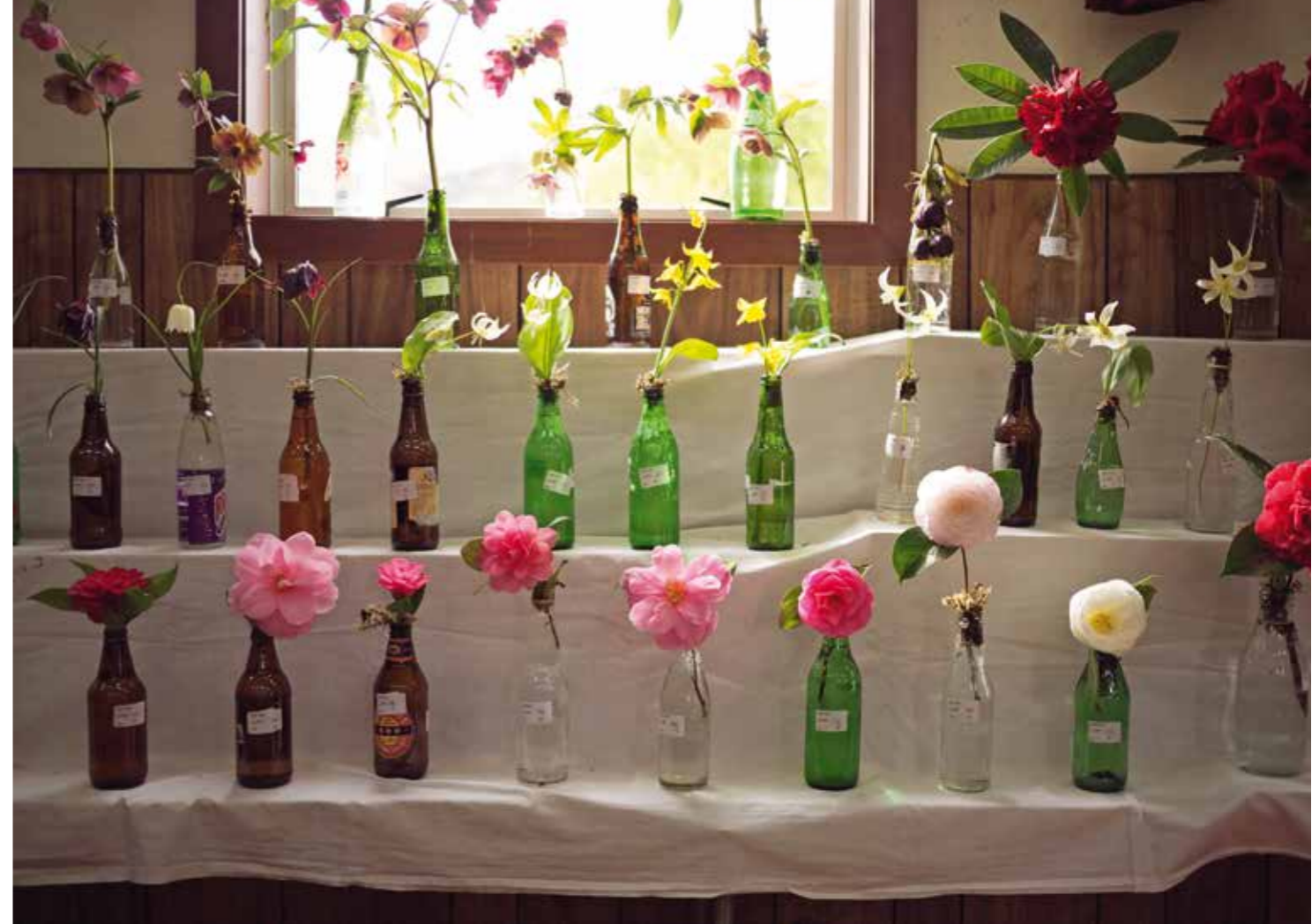
Camélias at the Glenorchy flower show , 2011. Camélias présentés au Concours floral de Glenorchy , 2011.

covering Glenorchy and staying overnight at Dwell remind me that while I still have to go to the absolute outer limits of my imagination—I can't skip my dreams and plans—my outer limit is exactly that, a limit. I never imagined it possible to simultaneously feel both the connection to the expansive divine and the intimate interpersonal connection, in the way I did when visiting the magical hut high up on the mountain. My big leap of faith has been to trust life, to trust that what life will actually present will be better than whatever I've imagined. //