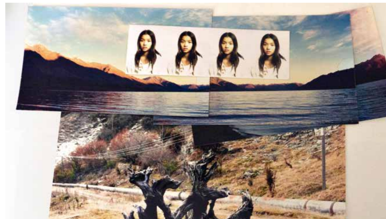
Documentary research for Top of the Lake. Recherches documentaires pour Top of the Lake.

Le bureau de Jane Campion se trouve au 4 e étage d'un immeuble Art déco dans le centre de Sydney. Le hall d'entrée est lambrissé de bois et un petit écriteau près des portes grillagées de l'ascenseur indique, dans une élégante écriture à l'ancienne : « Colporteurs, démarcheurs, porte-à-porte interdits. » À sa demande, j'avais accepté avec plaisir de passer quelques après-midi ensemble à regarder des images et parler de son profond attachement à la nature sauvage de l'île du Sud de la Nouvelle-Zélande, où elle avait récemment tourné la série télévisée Top of the Lake . C'est donc ce que nous avons fait, à grand renfort de thé, servi dans les tasses d'un délicat service en porcelaine vert et or déniché chez un brocanteur. Une belle curiosité d'ailleurs – l'une des soucoupes avait été autrefois rafistolée avec des agrafes. Il est impossible de saisir toute la « Jane-itude » de Jane, sa générosité, sa bonne humeur, et son assurance posée, sans prétention. Mais la voici néanmoins : Jane Campion, telle que racontée à Julia Leigh.