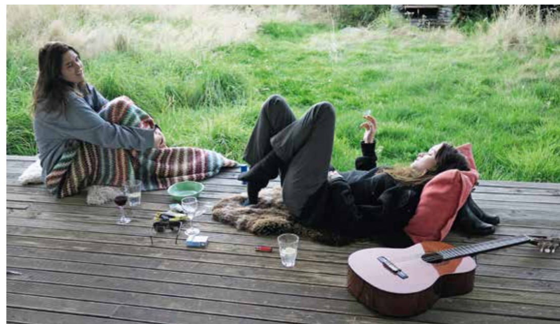
"Tintin and Alice relaxing on the veranda of our hut." «Tintin et Alice sur la terrasse de notre cabane.»