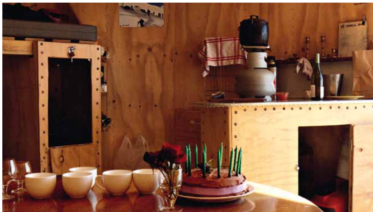
Celebrating the birthday at the Dwell guest hut , 2013.

« Pour Top of the Lake (TOTL) , tourné dans les environs de Glenorchy, j'ai commencé par essayer d'écrire un roman, mais cela ne marchait pas très bien. J'avais quelques idées : j'aimais les montagnes et le lac Wakatipu ; j'aimais les romans policiers ; j'aimais l'idée d'un paradis où les femmes post-ménopausées vont panser les blessures de guerre accumulées au