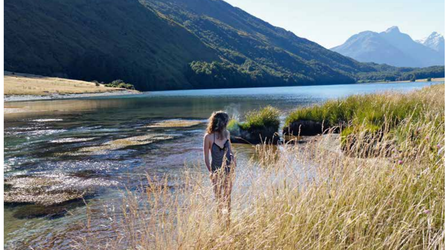
"At Diamond Lake Stream where we swim in summer ..." «Diamond Lake Stream, là où nous nous baignons l'été...»