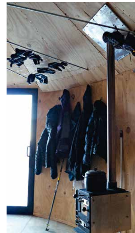
The Dwell guest hut in the Southern Alps of New Zealand. Refuge de Dwell, Alpes du Sud néo-zélandaises.

B ecause you asked I'll tell you: I'm a big believer in John Keats' Arcadian ideal, in the Romantic belief that by stepping out of the city and spending time immersed deep in nature you can find for yourself a balance, a healing. The landscape in its natural and perfect way will help you understand what it is that is natural and perfect within you. There's a beautiful line in a letter from Keats to Benjamin Bailey in 1817: "The setting sun will always set me to rights, or if a sparrow come before my window, I take part in its existence and pick about the gravel." I've had this affinity for being in nature from an early age. Growing up on the North Island in New Zealand I remember that my absolute favorite thing to do as a kid was to go down to the Waikanae River, to climb on the rocks, swim, tramp through the bush. That was where I felt happiest, energized, vigorous. And it's a feeling I have kept coming back to all my life.